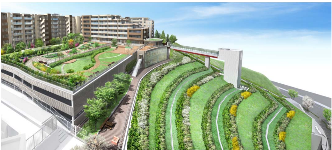
▲ 「屋上庭園と斜面庭園」完成予想図