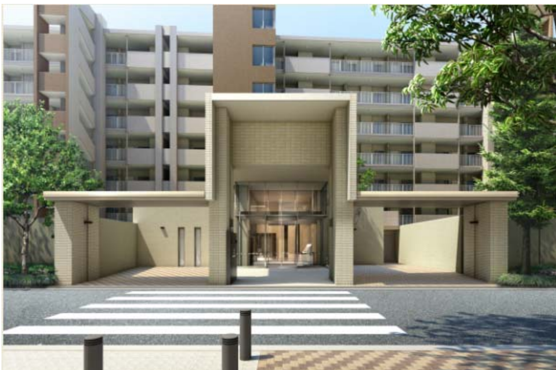
▲ マウントサイドフォート エントランス 完成予想図