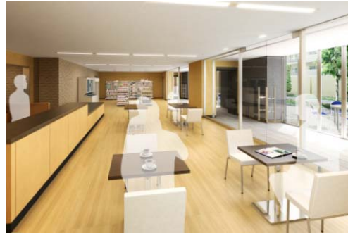
▲ カフェ&ミニショップ