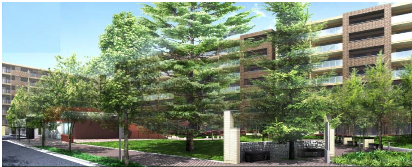
▲ 「セントラルガーデン」完成予想図

※ 第一工区278戸（建築確認取得済）と次工区以降431戸（2012年6月建築確認取得予定）を併せた戸数です。