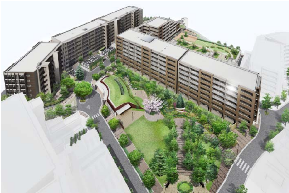
▲ 「ザ・パークハウス 追浜」第一工区 完成予想図