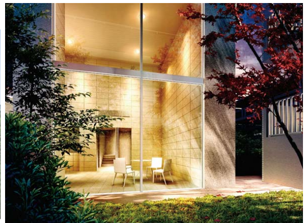
▲ 共用棟（コモンプラザ）内のホール