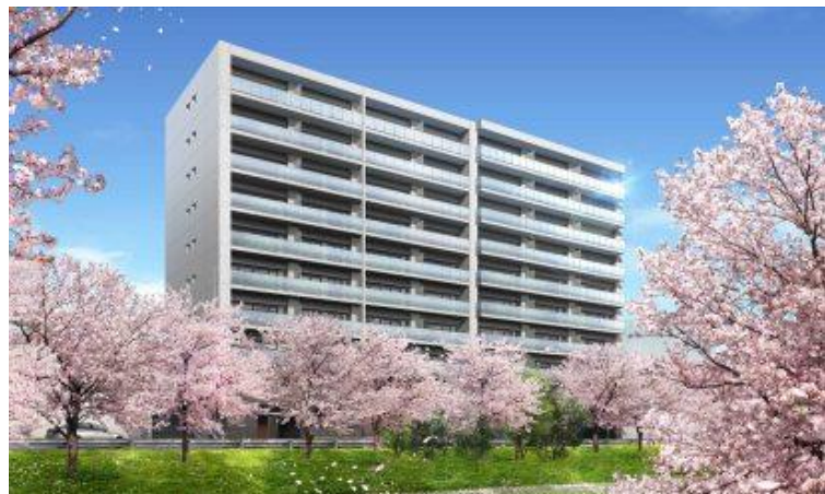
▲「ザ・パークハウス 新大宮」完成予想 CG