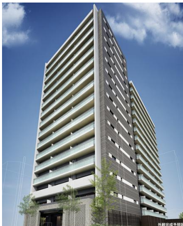
▲「ザ・パークハウス 大阪福島」完成予想 CG

三菱地所グループでは、『soleco』をはじめ、電気自動車対応システム『sölev（セレヴ）』、太陽熱をマンションに活用した新型給湯システム『solecoジョーズ』、既存マンション向けの高圧一括受電+太陽光発電システム『soleco fit』を開発しており、今後も家庭部門におけるCO2削減に寄与するマンションの開発を進めてまいります。