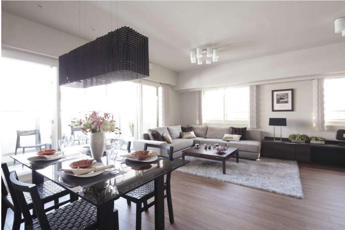
▲モデルルーム (F2タイプ、101.86㎡、3LDK (メニュープランで4LDKを3LDKに変更)) 写真