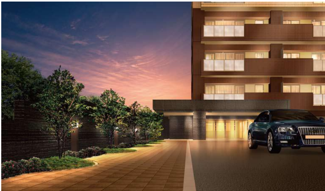
▲エントランスアプローチ完成予想CG