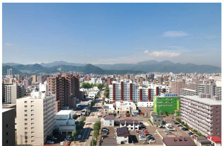
▲西側15階相当からの眺望