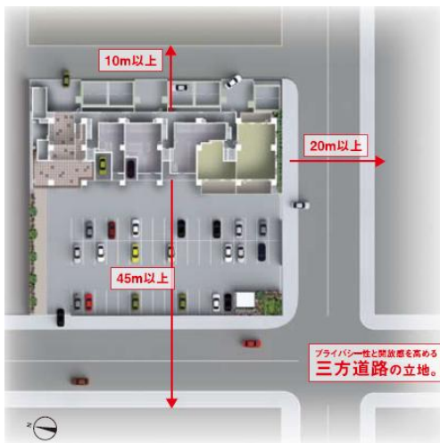
▲敷地配置イメージ図