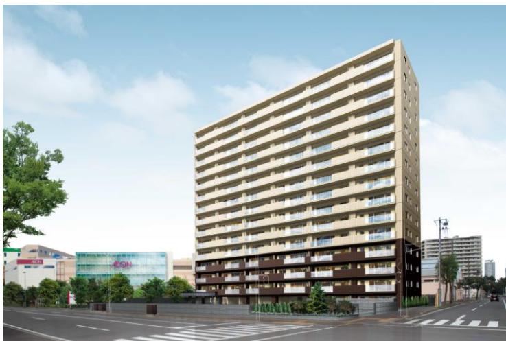
←「ザ・パークハウス 札幌桑園」完成予想CG