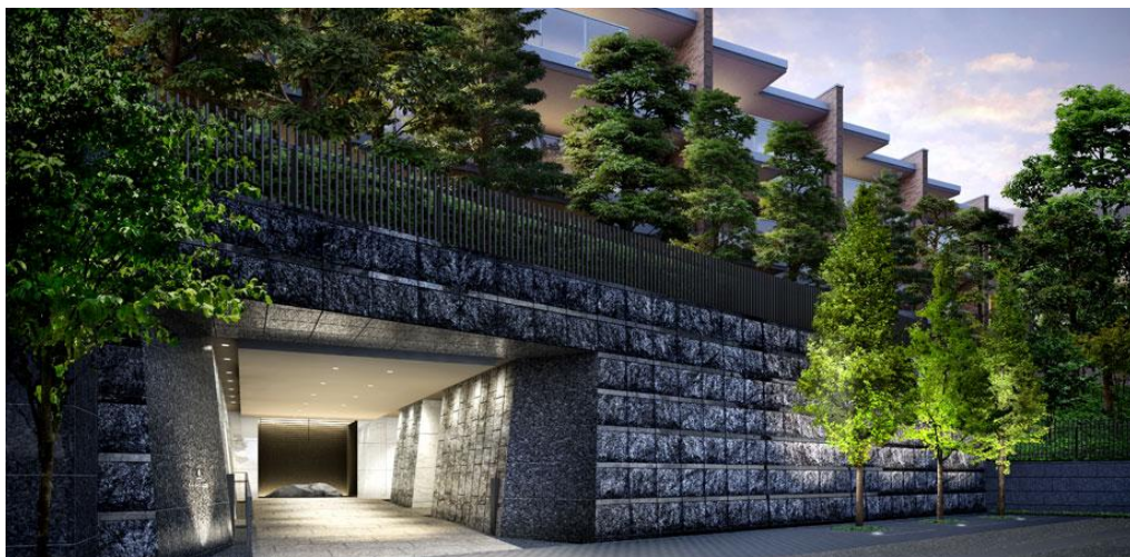
▲エントランス外観完成予想CG