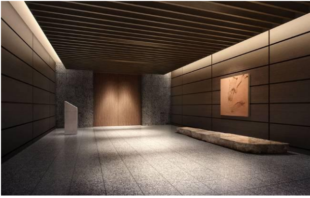
▲グランコリドー完成予想CG