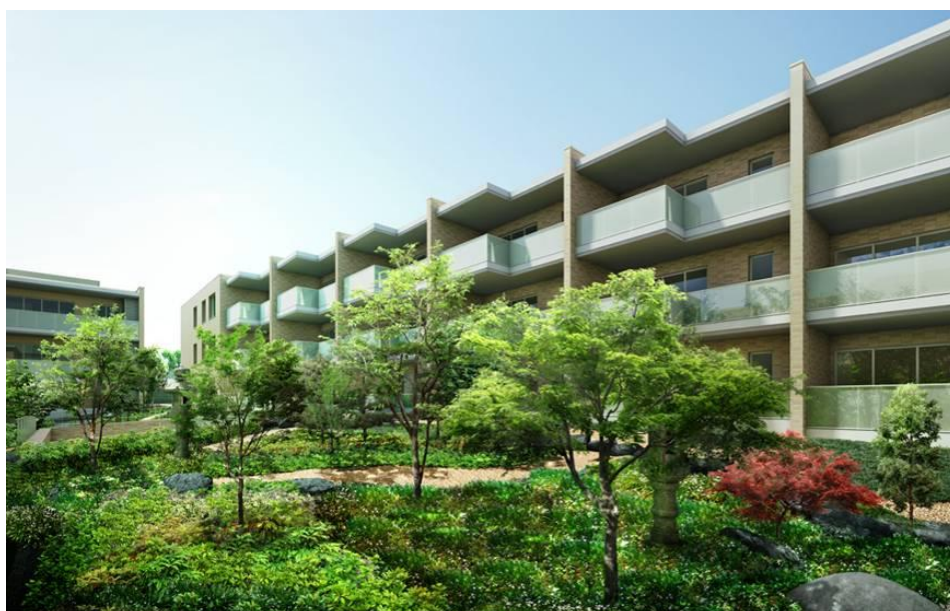
▲ 翠緑苑(中庭)完成予想CG