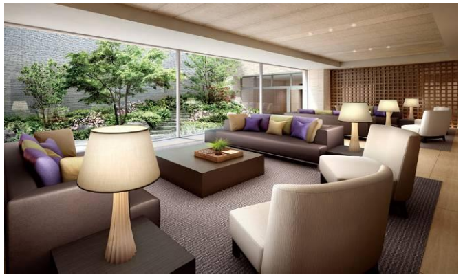
▲ライトコートラウンジ完成予想CG