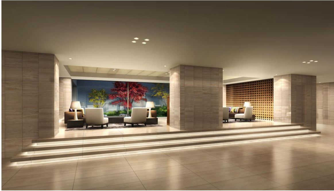
▲エントランスホール完成予想CG