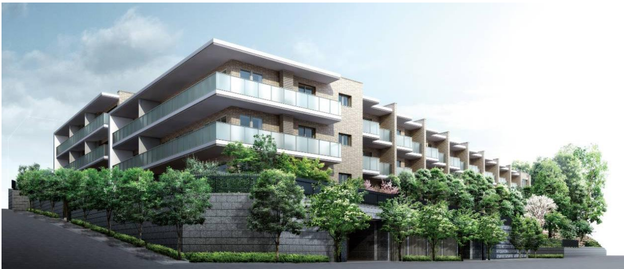
▲南東外観完成予想CG