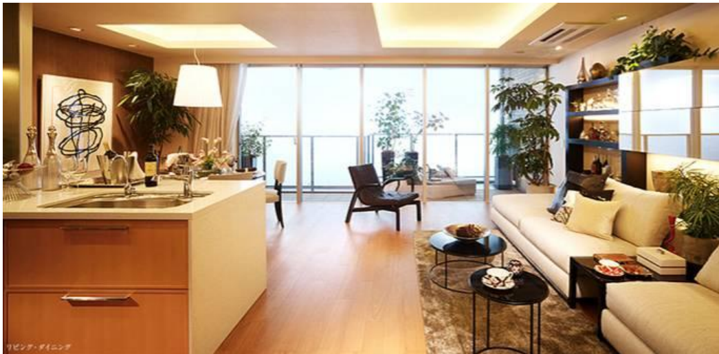
▲モデルルーム写真（粹林 105I タイプ・106.96㎡・3LDK）