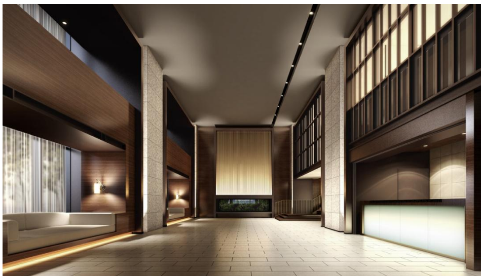
▲エントランスホール完成予想 CG

また高級感溢れる2層吹き抜けのエントランスホールには、ご入居者様やゲストだけが鑑賞できるオーナーズギャラリーを設置。さらには、家族や大切な友人を招いた際に、気兼ねなく泊まることのできるゲストルームも用意します。