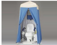
マンホールトイレ