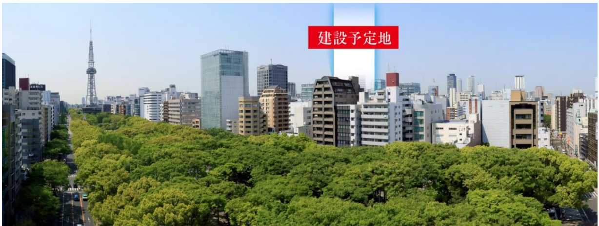
▲久屋大通公園越しに現地を望む