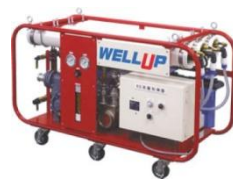
非常用飲料水生成システム