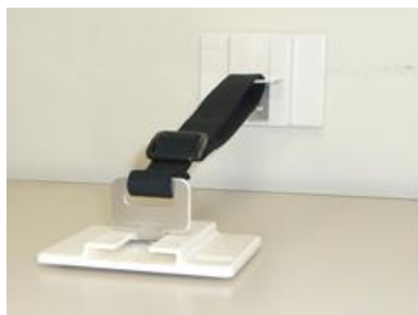
家具頂部の器具の一例

家具の足元の手前側には、地震時の家具の移動を防止するため滑り止め器具を設置しました。