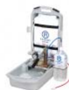
浄水器(レスキューアクア)