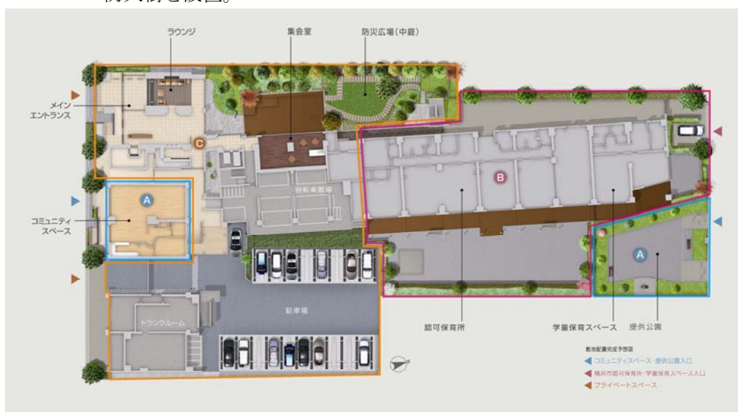
▲「ザ・パークハウス 戸塚」敷地配置完成予想図

三菱地所グループは今後も、地域とのつながりや良好な街並形成に寄与できるマンションづくりを進めてまいります。