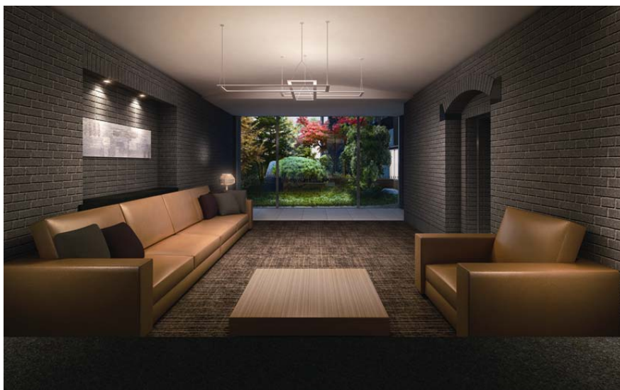
▲ラウンジ完成予想図