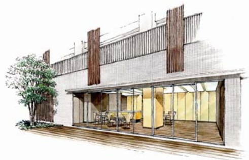
▲集会室・デッキスペースイメージイラスト