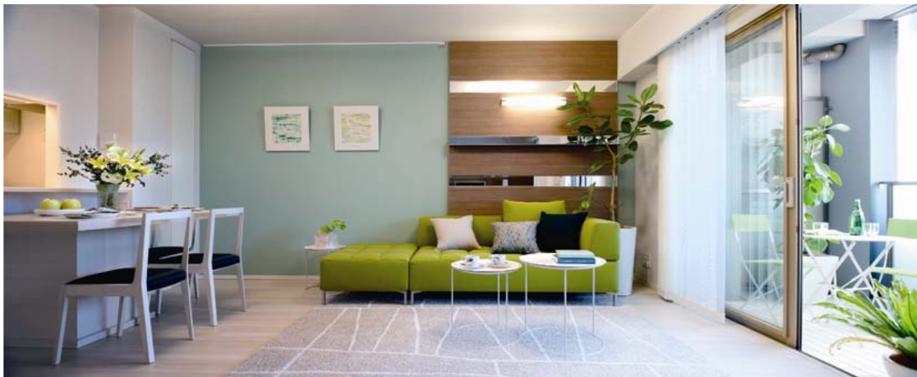
▲モデルルーム（Hタイプ・72.43㎡・3LDK）写真