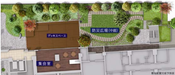
▲敷地配置完成予想図