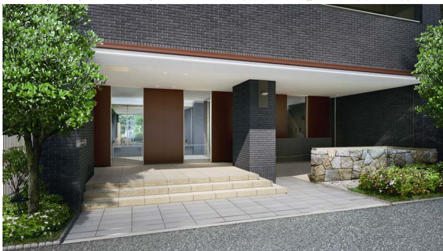
▲エントランス完成予想図

さらに、ラウンジは、重厚なタイル貼りとガラスで囲まれた透明感の高い洗練された空間としました。