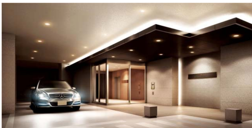
▲コーチエントランス（車寄せ）完成予想CG