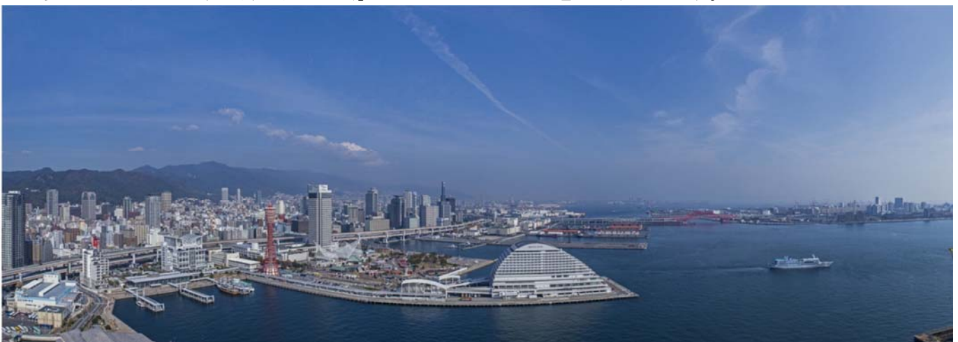
▲現地からの東方面眺望写真（36階相当）