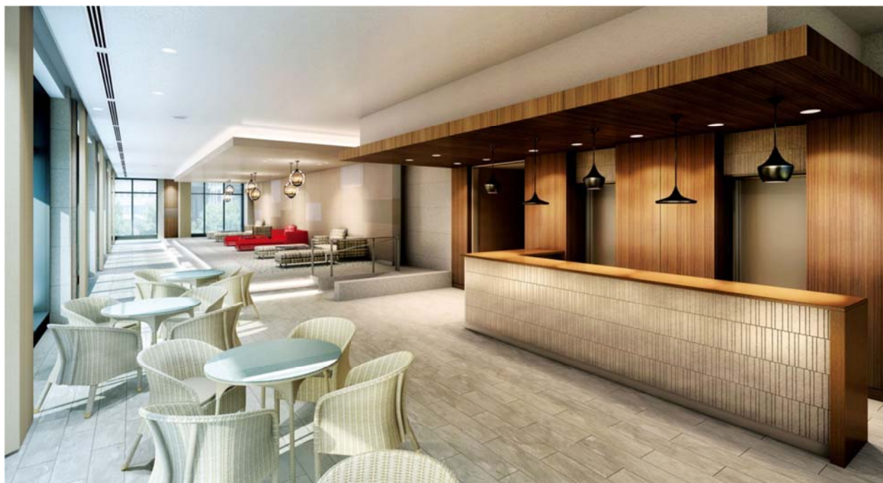
▲オーナーズラウンジ完成予想CG

オーナーズラウンジ、ビューラウンジ、ゲストルーム、キッズルーム、エスカレーターウォールのデザイン 及び家具等をコーディネート。