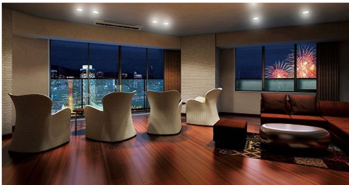
▲ビューラウンジ完成予想CG