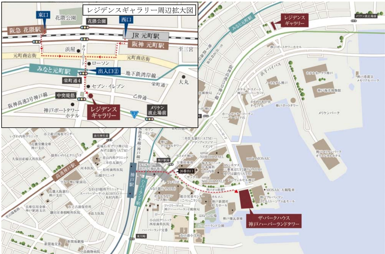
▲現地・レジデンスギャラリー案内図

物件URL： http://www.mecsumai.com/tph-kobeharbor/