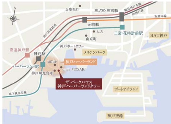
▲周辺エリア概念図