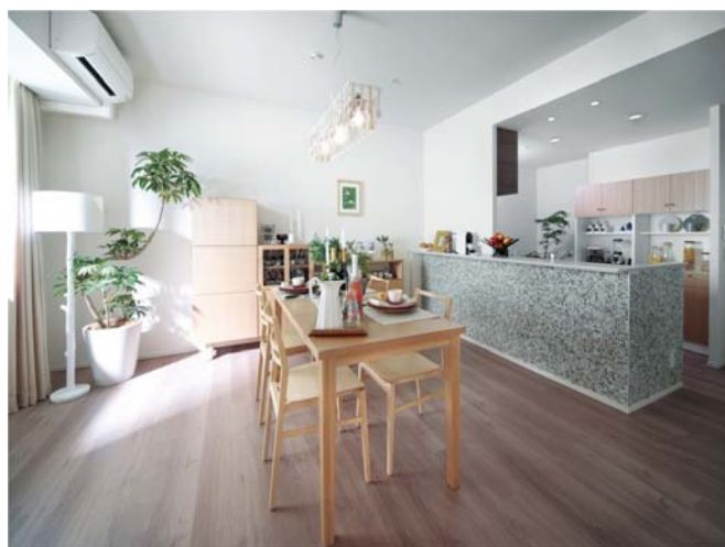
▲SHタイプモデルルーム

(2) SHタイプ(2LDK/90.28㎡) ホワイトアッシュで統一された家具で、 洗練された空間。