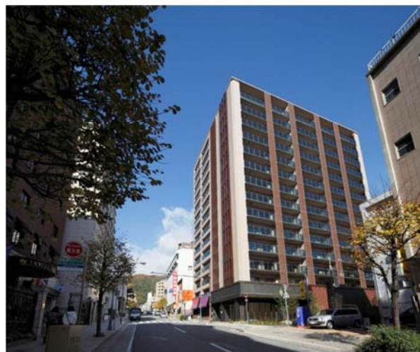
▲「ザ・パークハウス 神戸トアロード」外観写真 (2012年10月竣工済)

神戸市中央区中山手通2丁目の総戸数91戸からなる神戸市内では初めての「The SAZABY LEAGUE」コラボレーションマンション。モデルルームは「The SAZABY LEAGUE」のファッションブランド『エストネーション』が「大人の洗練された暮らし」をテーマにフルコーディネートしました。