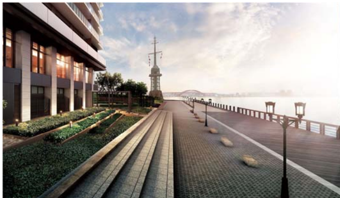
▲ハーバービューテラス完成予想CG