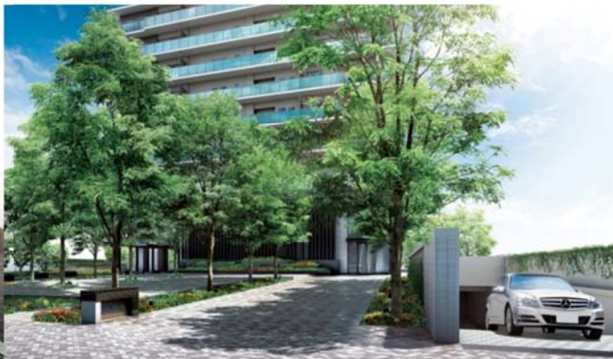
▲ガーデンテラス完成予想CG