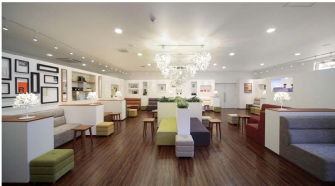
▲レジデンスギャラリー ラウンジ