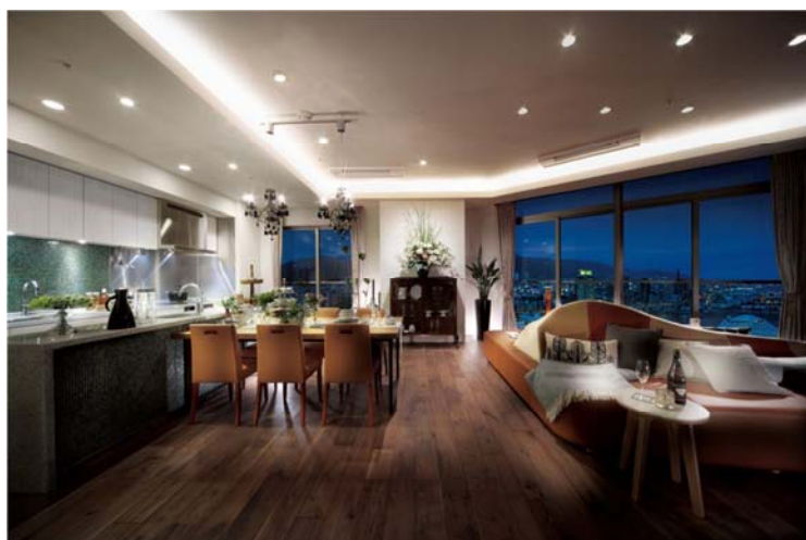
▲PFタイプモデルルーム

(1) PFタイプ(2LDK/144.04㎡) チーク材とステンレスのコンビネーション、 ロンドンアンティーク家具をレイアウトした 大人の感性が薫る住まい。