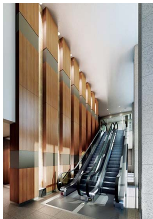
▲グランドエントランス完成予想CG