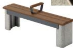
▲かまどベンチ (参考写真)