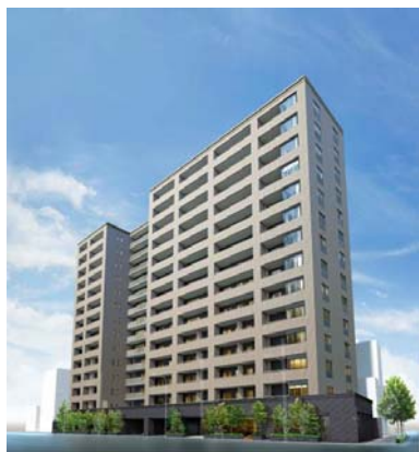
▲建物外観完成予想CG

「ザ・パークハウス 上野」は2014年1月14日にホームページを開設し、これまで1,500件超のお問合せを頂戴しているほか、4月12日より開始した事前案内会ではご来場数が約300件と、非常に多くの反響をいただいております。