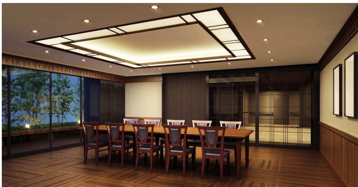
▲ラウンジ（集会室）完成予想CG