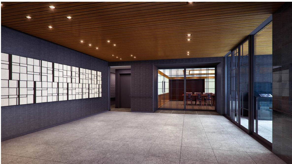
▲エントランスホール完成予想CG