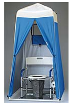
▲マンホールトイレ (参考写真)