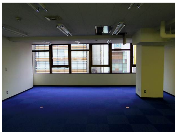
< before >