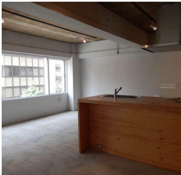
< after >