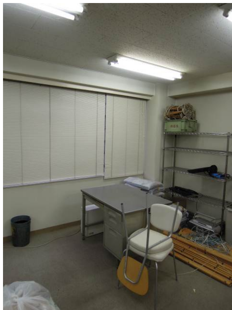
< before >