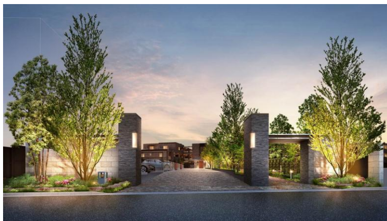
▲グランドゲート完成予想 CG

三菱地所レジデンスでは、今後も経済性と快適な生活を実現する環境配慮型アイテムの積極的な活用を通じて「ECO EYE'S(エコアイズ)」の考えをより一層強化するとともに、当マンションならではの暮らし方をお客様にご提案し、「ザ・パークハウス」のブランド価値向上を図ってまいります。