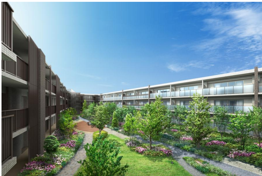
▲グランドガーデン完成予想 CG