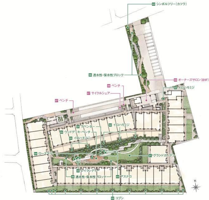
▲敷地配置イメージイラスト