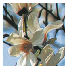
▲練馬区の区木「コブシ」(参考写真)