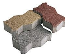
▲保水性ブロック (参考写真)