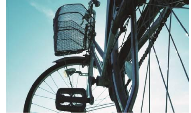
▲電動アシスト付きサイクルシェア（イメージ）