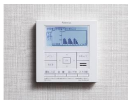
▲高機能エネルギーリモコン (参考写真)