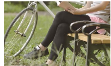
▲再生木材利用ベンチ（イメージ）