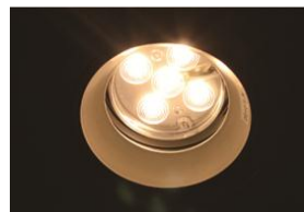
▲LED 照明 (参考写真)