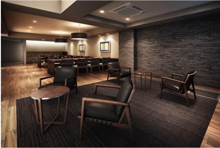
▲オーナーズサロン完成予想 CG