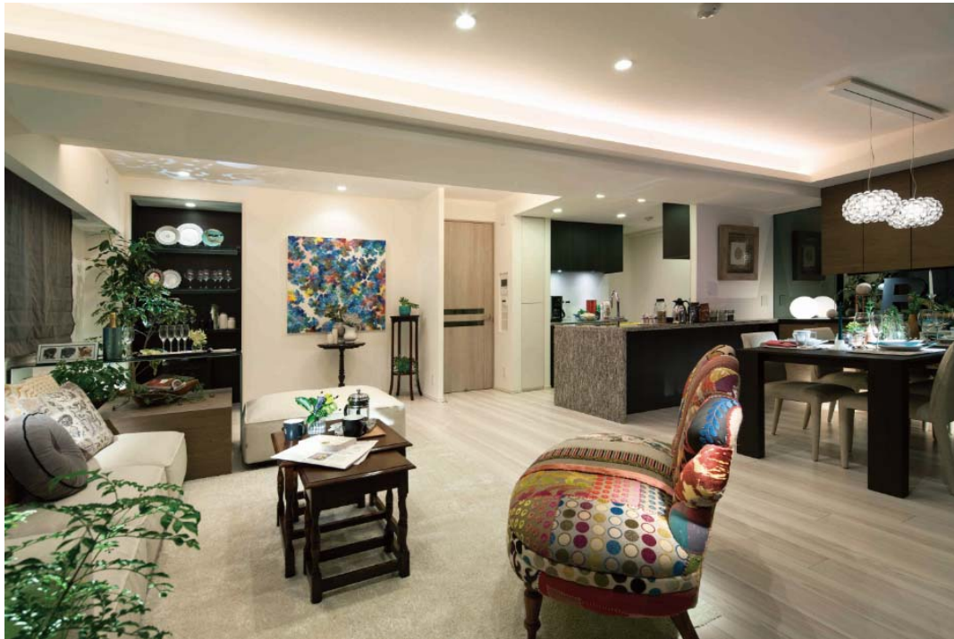
▲B-F タイプモデルルーム