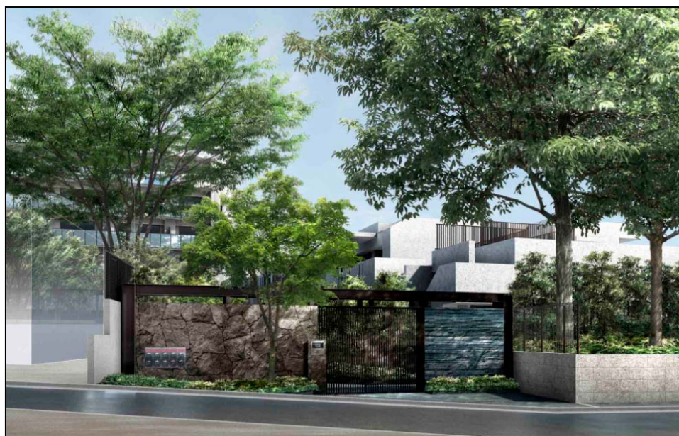
▲サブエントランス完成予想CG