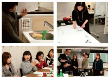
4台の試作品をご覧いただきながらの顧客座談会

開発段階の商品を実際に見て触れてもらいながら、座談会を行います。試作品に対するご意見や現在ご使用の設備類について使い勝手など伺っています。