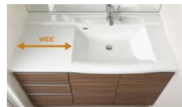
▲① 「EYE'S PLUS STORAGE LINEN」 ▲② 「EYE'S PLUS BATHROOM 2015」 ▲③ 「EYE'S PLUS LAVATORY 2015」

当社では、今回新たに開発した3商品を、2015年4月以降順次「ザ・パークハウス」物件に原則導入していきます。今後ともお客様の声に耳を傾け、より一層お客さまにご満足いただける住まいの提供を目指します。