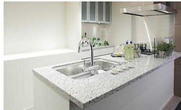
フルフラットカウンター