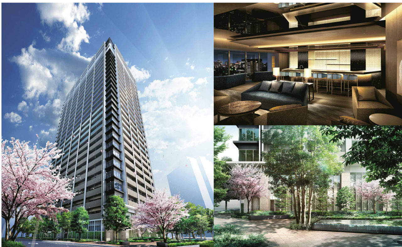
（左：外観イメージ、右上：スカイラウンジイメージ、右下：水と緑の広場イメージ）

本物件は、公開空地や地域用防災備蓄倉庫の設置など魅力ある街づくりへの貢献が評価され、総合設計制度等を利用しています。それにより容積率の緩和を受け、地区の建物高さ制限（38mあるいは50m）を上回る、高さ約100mのタワーレジデンスを実現しました。遮るもののない眺望を愉しめるスカイラウンジや、足元には約50本もの木々を植樹し、敷地面積の約50%にも及ぶ公開空地を創出。都市と自然が調和する新たな居住環境を創造します。さらに、計画地は全方道路に囲まれた一街区の好立地です。