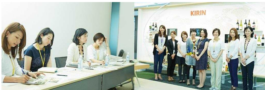
(左 : Bloomoi メンバー、右 : KIRIN グループのオフィスにて、KIRIN グループ女性社員と Bloomoi メンバー)