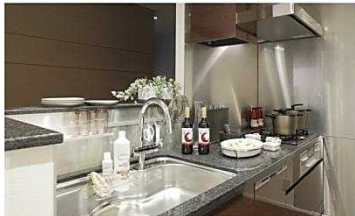
手元が隠れるカウンターキッチン