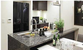
対面カウンターキッチン