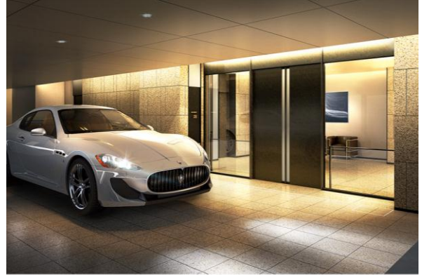
▲地下駐車場サブエントランス完成予想CG