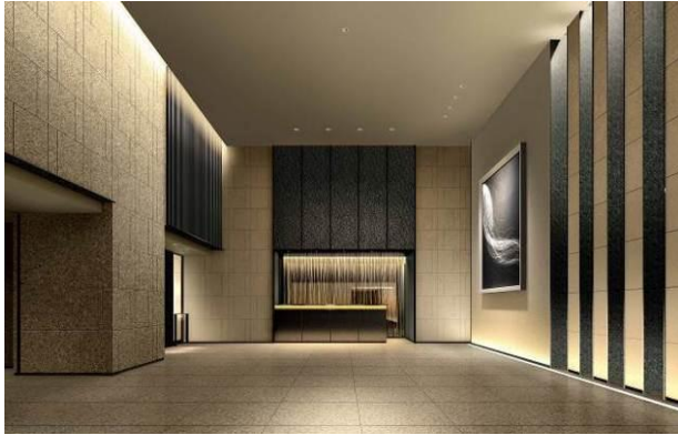
▲エントランスホール完成予想CG