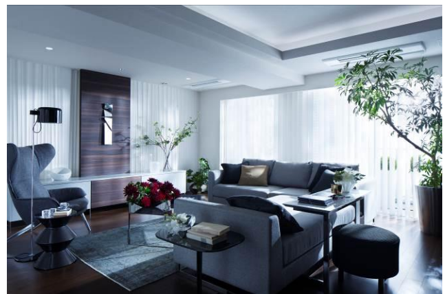
▲モデルルーム写真