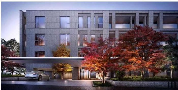
↑建物外観完成予想CG（メインエントランス側）→