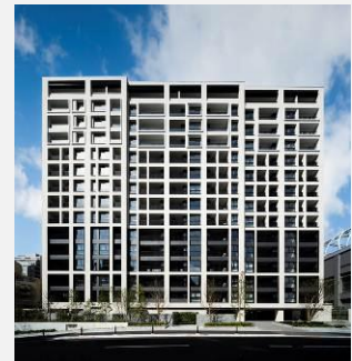
▲「ザ・パークハウス グラン 三番町」