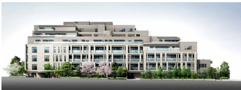
▲「ザ・パークハウス グラン 南青山」外観完成予想CG

共用部においても、地下に自走式駐車場を設け、2つのサブエントランスにはそれぞれ車寄せスペースを確保。アーキサイトメビウス株式会社をデザイン監修に迎え、「世界が息をのむ青山の邸宅」を設計コンセプトに、ランダムに配置したマリオンと天然御影石の重厚感、彫りの深いデザインが見せる奥行きや陰影によって豊かで落ち着いた趣のある外観とし、青山にふさわしい邸宅の趣を表現します。