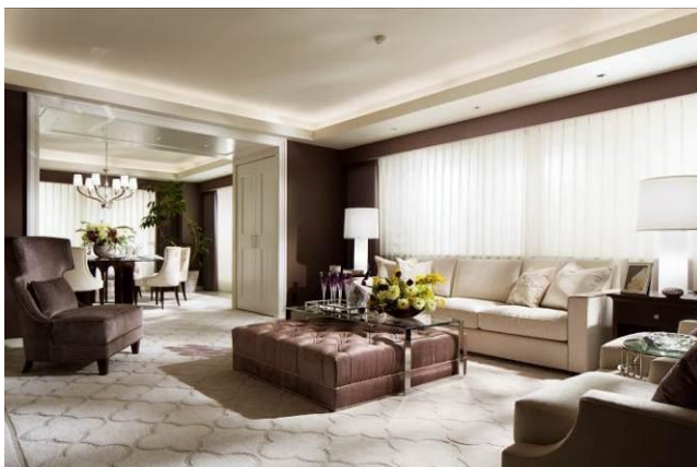
▲モデルルーム写真