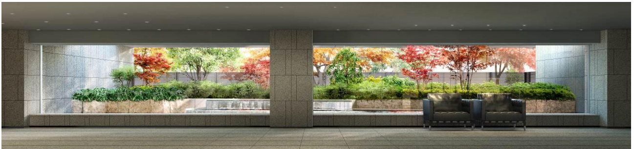
▲ラウンジ完成予想CG (秋)

※ご利用時間・方法等の詳細は管理規約集をご確認ください。また、計画段階のものであり変更になる場合があります。※サービスの内フロントショップサービスとクリーニング取次サービスなどは有償となります。