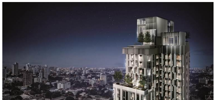
▲上層部分完成予想 CG