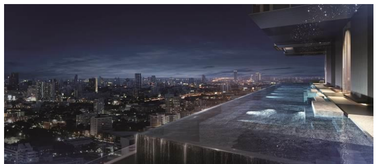
▲スイミングプール完成予想 CG