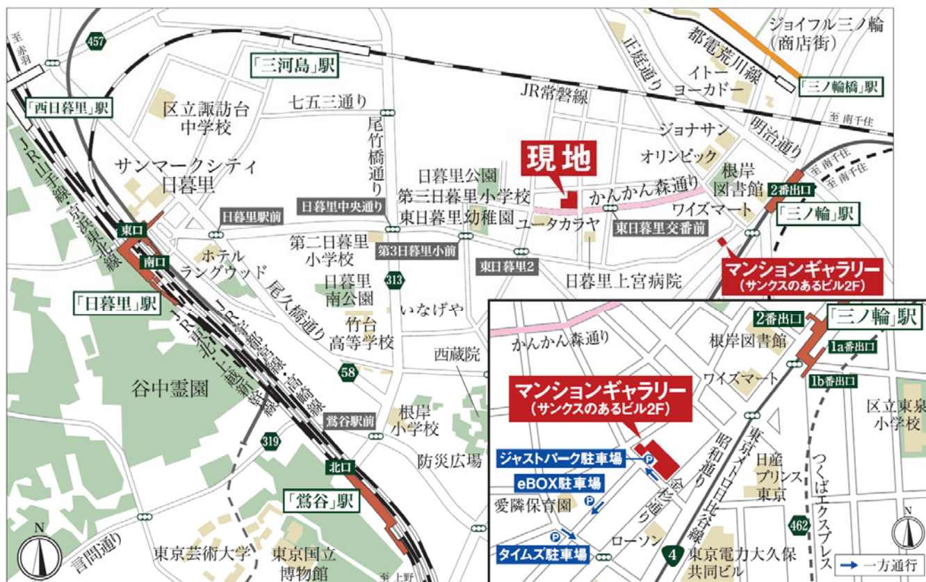
＜「BELISTA東日暮里」現地案内図＞

マンションギャラリーにお車で越しの方は、周辺のコインパーキングをご利用ください。駐車券をマンションギャラリーにお持ち頂くと、お帰りの際にご清算させていただきます。