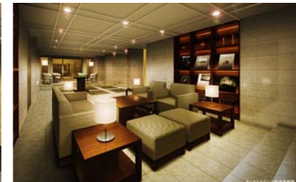
イストラウンジ完成予想 CG