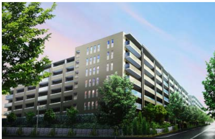
「ザ・パークハウス 市ヶ尾」完成予想CG