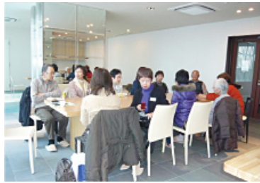
シニアのお茶会 (パーティールーム使用予定)