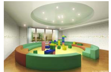
キッズルーム完成予想 CG

お子様用の遊具を揃え、雨天や寒暑の厳しい季節ものびのびと遊んでいただける空間です。