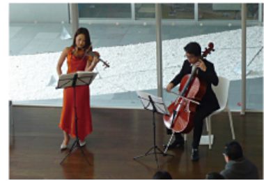
ラウンジコンサート&ミニパーティ (エントランスラウンジ、パーティールーム使用予定)