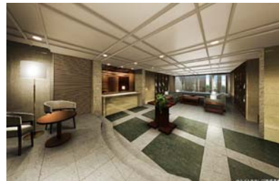
ウェストラウンジ完成予想 CG

ご友人との待ち合わせや歓談、読書などにお使いいただけるラウンジを、各棟にご用意いたしました。