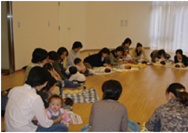
子育て交流会 (パーティールーム、キッズルーム使用予定)

■居住者交流プログラム:ご入居後の早期に、マンション全体の交流を目的に下記の交流イベントを開催します。