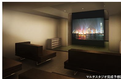
マルチスタジオ完成予想図

大型スクリーンを備えたマルチスタジオでは、ご家族やご友人との映画鑑賞をお楽しみいただけるほか、ゴルフシミュレーターを装備し、ゴルフレッスンや、友人同士の集まりにご利用いただけます。