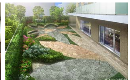
ロータスガーデン完成予想 CG