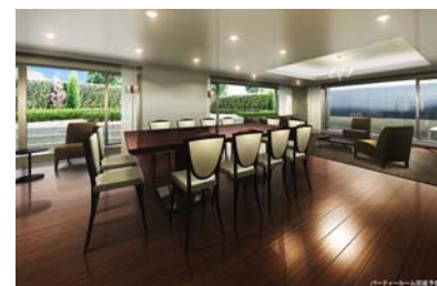
パーティールーム完成予想 CG

広々としたパーティールームは、キッチンも完備し、パーティや、隣接したロータスガーデンも使ったアフタヌーンティーなど、マンションにお住まいの方々のコミュニティの輪を広げる場としてもお使いいただけます。