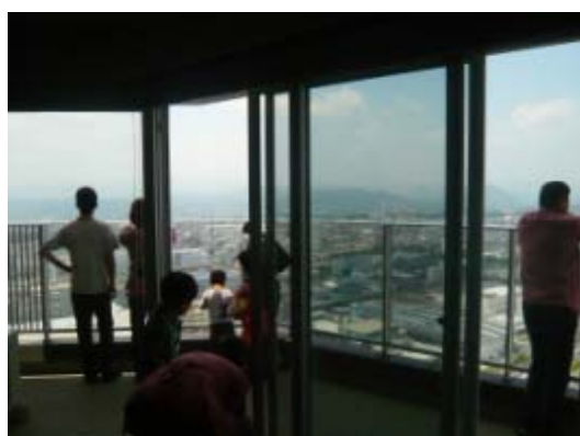
▲ ビューラウンジ見学