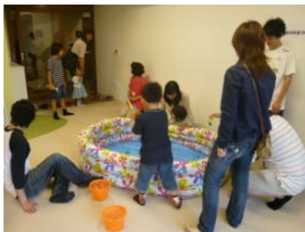
▲ こどものあそびコーナー