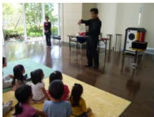
▲MID OASIS TOWERS「マジックショー」の様子

三菱地所レジデンスでは、震災を受け、地域とのつながり、居住者同士の顔が見える関係の必要性が見直される中、住む方々が豊かで楽しいふれあいのある生活を送っていただけるよう、特に様々な世代が混在する郊外の大規模マンションにおいて、コミュニティの形成支援に力を注いでまいります。