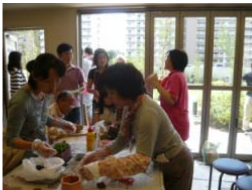
▲MINASIA湘南ライフタウン「寄せ植え」の様子

運営は、コミュニティ形成支援専門会社と提携して実施しており、入居後1～2年間専門会社がサポートを行いながら、徐々に居住者のコミュニティだけで運営が可能となるような体制をつくってまいります。