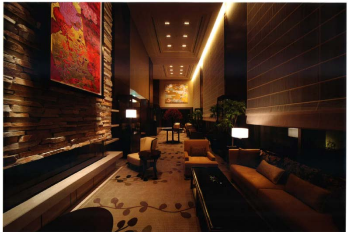
レセプションハウスでも体感できる「ザ・レセプション」(左)と「ザ・リビング」(右)