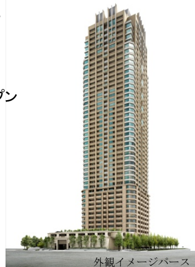
外観イメージパース