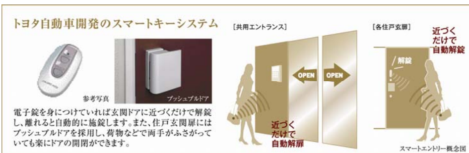
▲スマートキーシステム概念図

スマートキーはトヨタ自動車株式会社の登録商標です。また、防犯モード・共用エントランス用スマートキーシステムはトヨタ自動車株式会社、株式会社東海理化、美和ロック株式会社との共同開発品です。