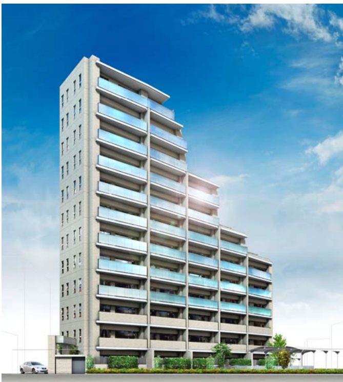
▲建物外観完成予想図