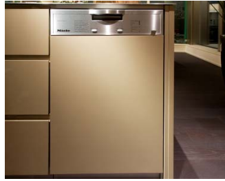
▲ミーレ社製の 食器洗い乾燥機