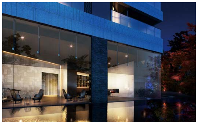
▲エントランスラウンジ完成予想CG(※2)