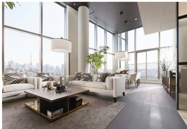
←120-cタイプモデルルーム

(※1) 1970年1月以降、階数19階以上のマンションは、港区西麻布、港区南麻布、渋谷区広尾アドレスで、当マンションのみです。(MRC調べ)