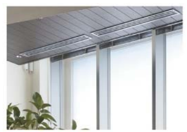
▲電動ブラインド・ 電動カーテンレール (※天井高4mの居室のみ)