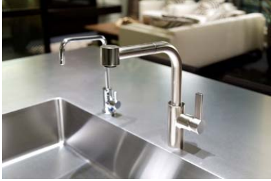
▲ドイツのドンブラハ社製 水栓金具（キッチン）