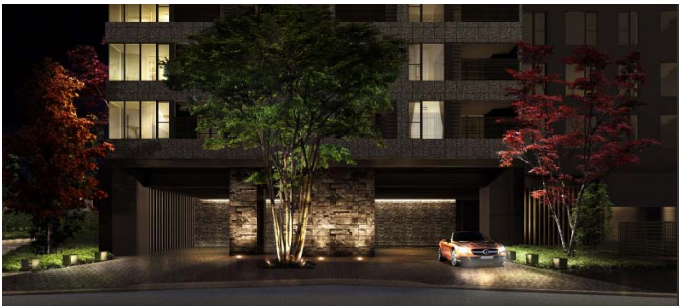
▲メインエントランス完成予想CG(※2)