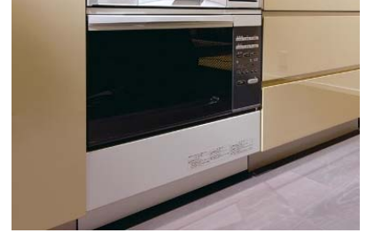
▲様々な調理を可能にする コンベック