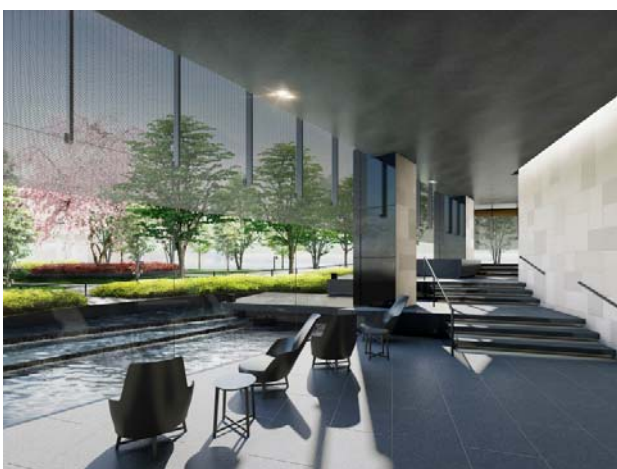
▲エントランスロビー完成予想CG(※2)