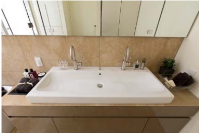
▲ドイツのケラマグ社製 ダブルサイズカウンターボウル (※一部住戸を除く) ドンブラハ社製水栓金具