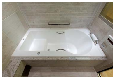
▲ジャクソン社製の浴槽 浴室ダウンライト調光