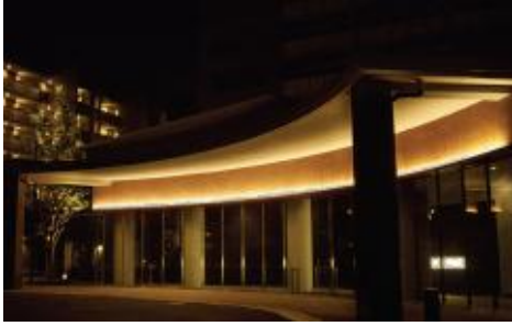
⑤ ヒルトップゲート正面の管理棟の光のライン