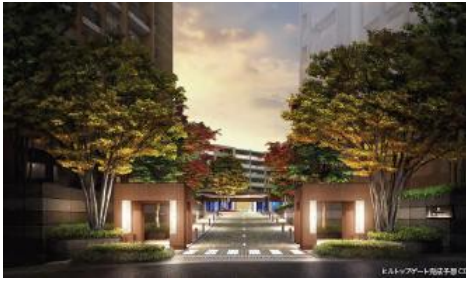
④ ヒルトップゲート