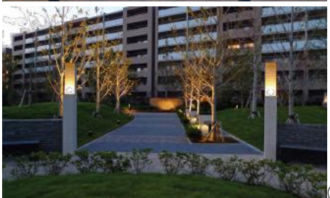
⑪ 光に浮かび上がる樹木とアート