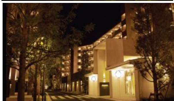
▲「ザ・パークハウス 追浜」外観