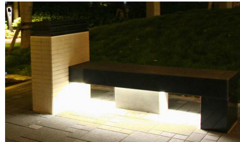
⑩ 光源を見せない照明