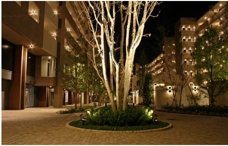
⑥ ウェルカムプラザ