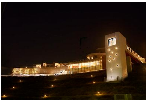
②エレベータータワーと手摺を利用したライン照明