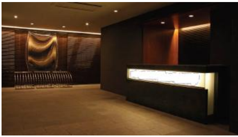
⑦ 共用施設棟タウンセンターのエントランスカウンター