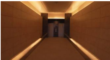
③壁上下の間接照明で奥行き感を強調したエレベーターホール