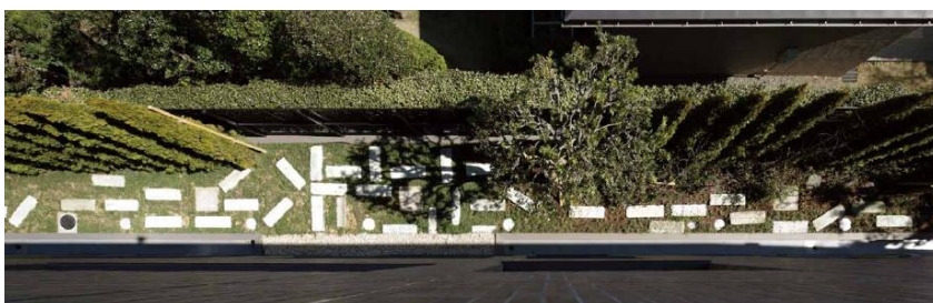
▲街と建物をつなぐ柔らかな緑のフェンス