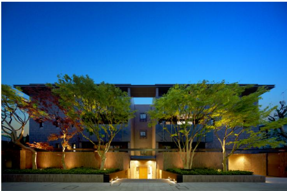
▲既存樹を活かした外構

歴史ある閑静な地に建つ住宅にふさわしい風格を備えている。深い軒、深く掘り込まれた開口部と、奥行き感のあるバルコニーが、立体的な形状のタイルとともに、外観に深みと重厚感を与えている。既存の古木や旧邸宅の庭園で時を刻んできた景色を現代の職人の技を使って再生し、現代の住宅の中で歴史を感じさせる落ち着いた空間を実現させている点を評価したい。