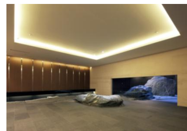
▲保存された青石、大谷石