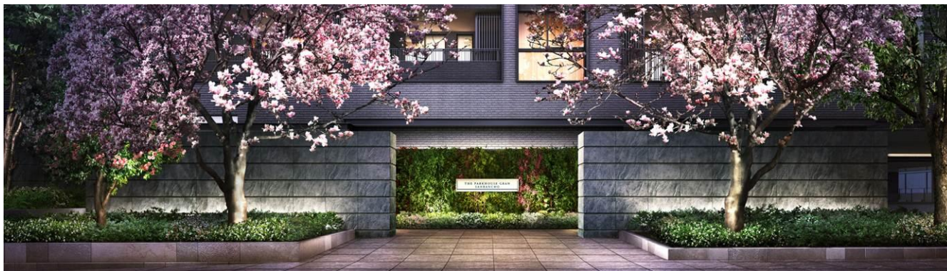
▲東南外観完成予想CG