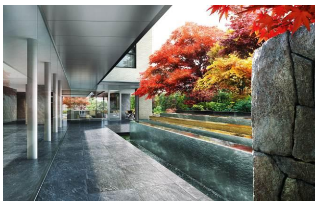
▲中庭水盤完成予想CG