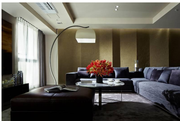
▲モデルルーム写真（120Aメニュープラン（120.03㎡・2LDK+2WIC+SIC））