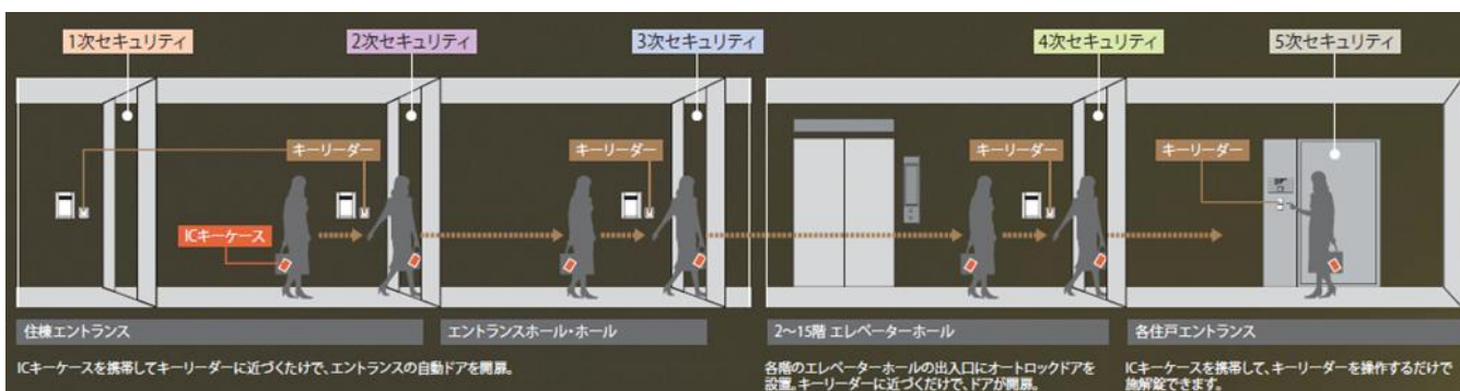
▲セキュリティシステム概念図