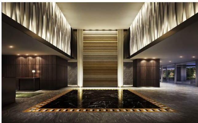
▲エントランスホール完成予想CG