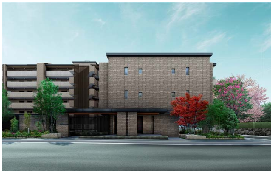
▲「ザ・パークハウス 池下」外観予想CG

三菱地所グループでは、「soleco」をはじめ、電気自動車対応システム「sölev（セレヴ）」、太陽熱をマンションに活用した新型給湯システム「solecoジョーズ」、既存マンション向けの高圧一括受電＋太陽光発電システム「soleco fit」を開発しており、今後も家庭部門におけるCO2削減と電気代削減による経済性を両立するマンションの開発を進めてまいります。