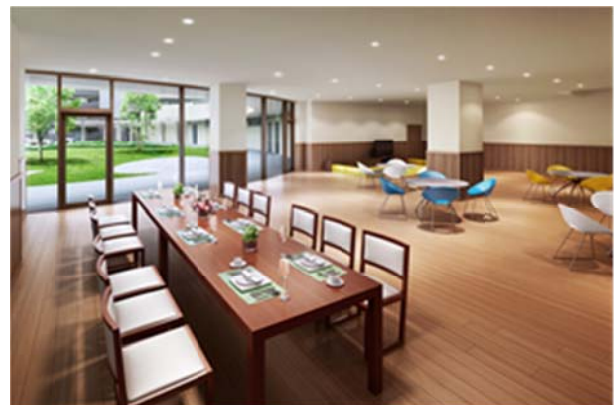
▲カジュアルラウンジ