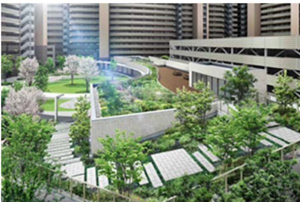
▲ヒルトップガーデン