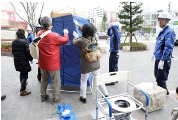
▲「マンホールトイレ組み立て訓練」の様子