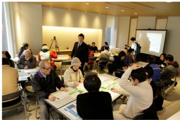
▲「被災生活ワークショップ」の様子