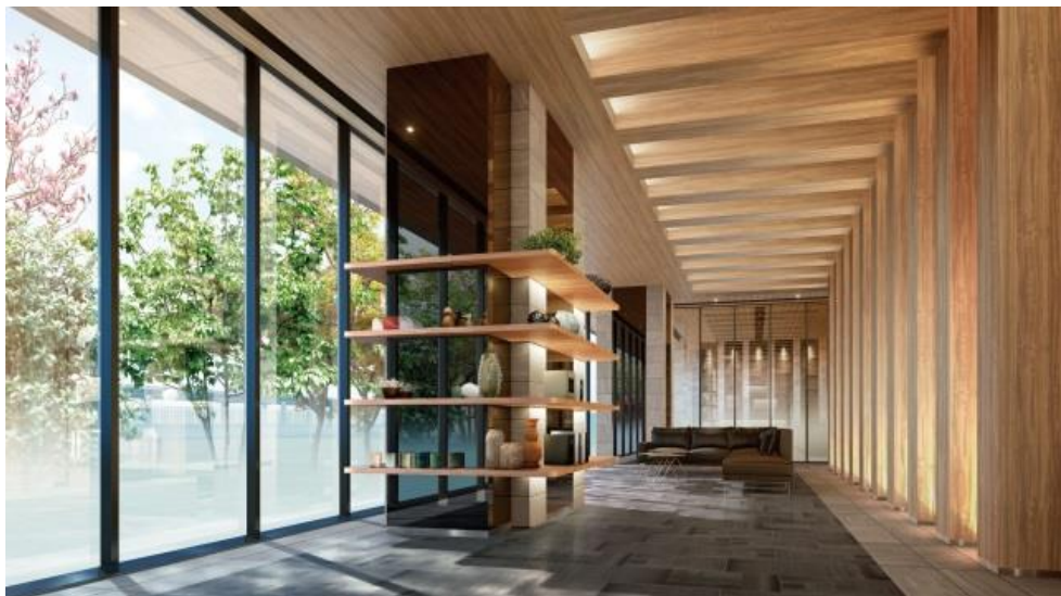
▲ラウンジ完成予想CG