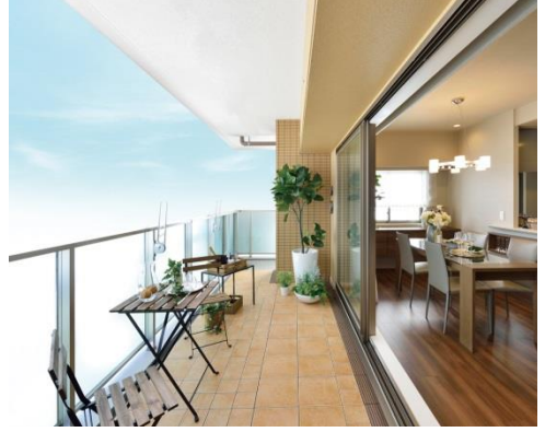
▲Aタイプモデルルーム(90.98㎡、メニュープラン3)