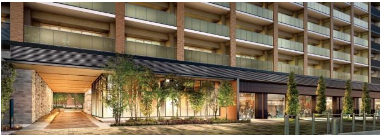
▲外観(プロムナード)完成予想CG

「にぎわい空間の創出」というテーマを実現するべく、ロータリーと一体となるプロムナードには、自然の優しさを物語る木々・ベンチが各所に設置され、多くの人が行き交い、集い、憩うことができるスペースとなります。「ザ・レジデンス廿日市駅前」の1階には、夜間にその周辺を優しく照らし出す照明設備を設置します。