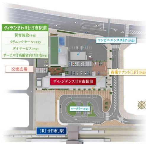
▲ランドプランイメージイラスト

書類審査及びヒアリングを通じ、にぎわい空間の創出として地域に開放されたプロムナードや、子育て・高齢者支援施設が集約配置された点、立地条件を活かした定住促進や少子高齢化への対応に資する機能、サービスの積極的な提案が本プロポーザルの審査委員会から評価され、3グループの応募の中から最優秀提案者に選定されました。