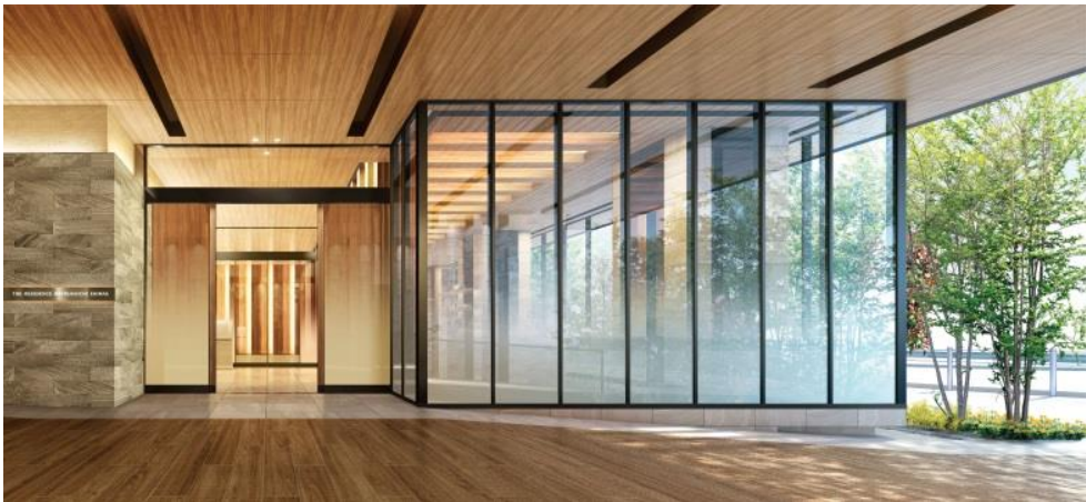
▲エントランス完成予想CG

「ザ・レジデンス廿日市駅前」の共用部では木目を活かし、自然の光と調和させた空間を創出。ロータリーと交流広場を結ぶコリドーの途中に設置するエントランス、その横に位置するラウンジはともに開口部にガラス面を多く採用し、自然の光があふれる空間で贅沢にリラックスする時間を過ごすことができます。