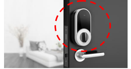
<NinjaLock 取り付けイメージ>