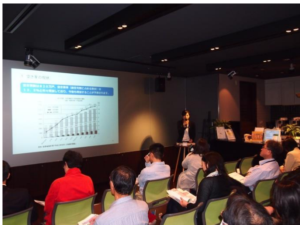
▲「空き家有効活用セミナー」の様子

三菱地所グループは、本年4月より、「空き家有効活用セミナー」を開始し、11月5日には5回目を実施しました。本セミナーは、三菱地所グループにて分譲・賃貸・管理する住まいの契約者・所有者・居住者を対象とした「三菱地所のレジデンスクラブ」会員を対象に開催し、相続等で空き家を所有するお客様や近い将来空き家を相続する予定のお客様など多くの方が参加されました。セミナー終了後の個別相談では、「空き家診断アドバイザー」がお客様の空き家の利活用について無料で相談に応じました。