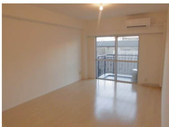
▲リフォーム実施後