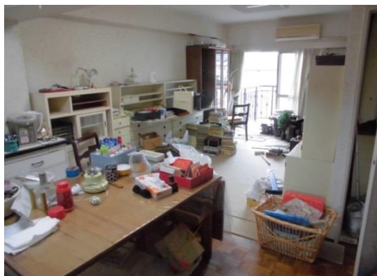
▲荷物整理・リフォーム実施前

港区にある築40年1LDK、55㎡の分譲マンションを相続したお客様の場合、自身が所有しているご自宅は別にあるため、相続時から空き家となっていました。荷物管理と維持管理のために月数回マンションを訪れていましたが、大量の荷物による多大な労力とマンション以外の金融資産を相続したことによる相続税の申告手続きの必要性から、当社による「空き家有効活用ワンストップサービス」を利用。空き家診断アドバイザーによる提案により、荷物整理、リフォームを実施し、その後のマンション売却も検討に入れた定期賃貸借による賃貸として活用を行いました。また、相続税の申告手続きの必要性から税理士の紹介も同時に行いました。