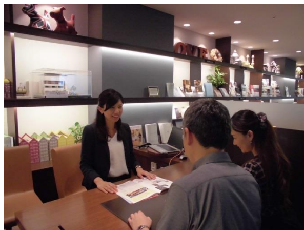
▲個別相談会の様子