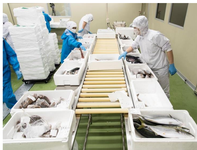
▲「羽田鮮魚センター」内での加工仕分けの様子