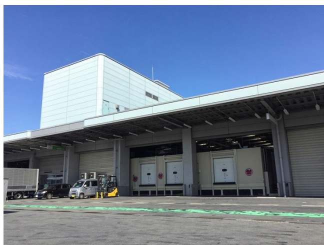
▲「羽田鮮魚センター」外観