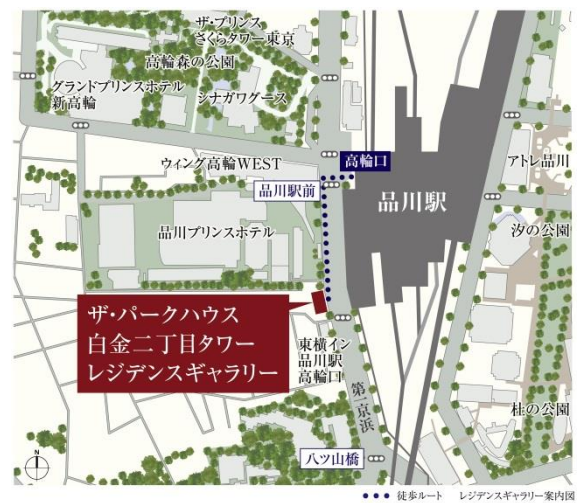
▲レジデンスギャラリー案内図