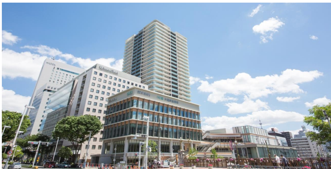
竣工写真：北西より区域全体を望む

10,000 m 2 超の敷地に住宅(プラウドタワー名古屋栄)・商業・オフィス等、多数の用途を取り入れた複合再開発(名称： Terrasse 納屋橋)となっております。堀川を見渡すように配した段状のテラスで各用途を結ぶことで、賑わいを演出し、既存環境との融合を目指した再開発事業となっております。