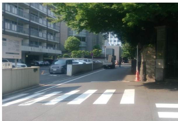
▲ 「メゾン三田」 西側道路