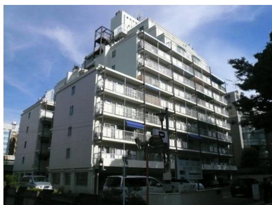
▲ 「メゾン三田」 外観