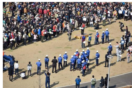
▲昨年の避難訓練の様子