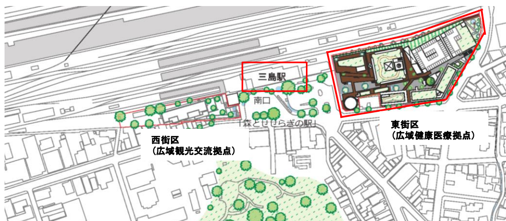
三島駅前の位置関係