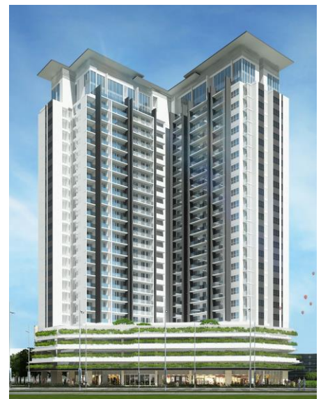
物件完成予想図(建物外観)

また、三菱地所グループはこれまでにベトナム・ホーチミン市にて計約2,000戸の住宅を分譲し、ハノイでは約1,300戸の住宅開発を行っています。ベトナムにおけるプロジェクトは初参画となる三菱地所レジデンスは、現地デベロッパーとの合弁会社を立ち上げているタイをはじめ、マレーシア、インドネシア、オーストラリアでの住宅開発事業に参画しており、現在までに参画した案件は24物件(総戸数19,000戸超)となっています。