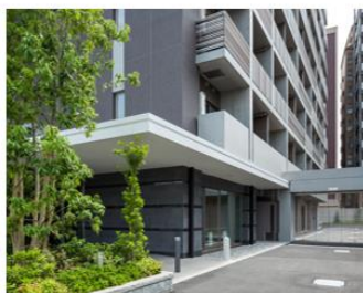
ザ・パークハビオ 巣鴨