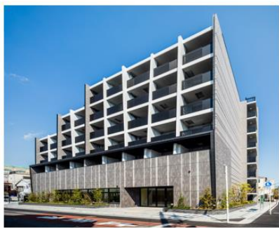
ザ・パークハビオ 西大井