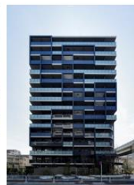
ザ・パークハビオ 木場