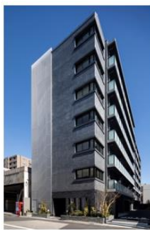
ザ・パークハビオ 住吉