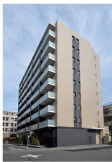
ザ・パークハビオ 早稲田