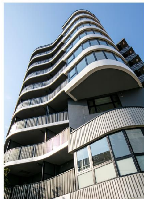
ザ・パークハビオ 神楽坂