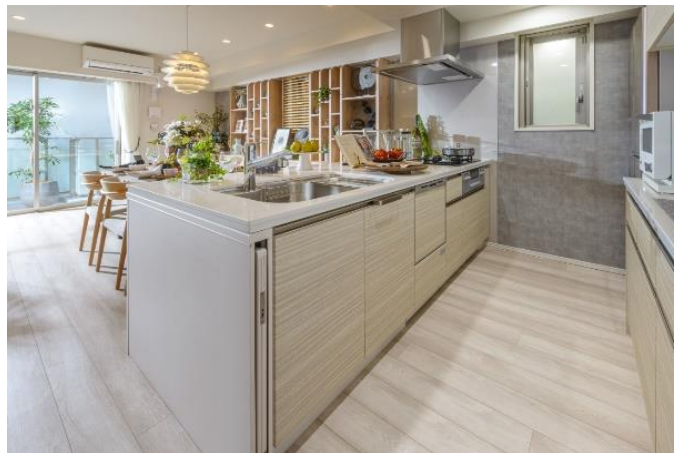
▲「ザ・パークハウス 経堂レジデンス」 モデルルームイメージ