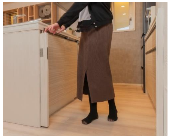
▲キッチンゲートのイメージ