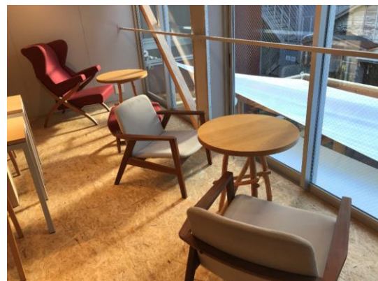
▲リユース品を利用した家具