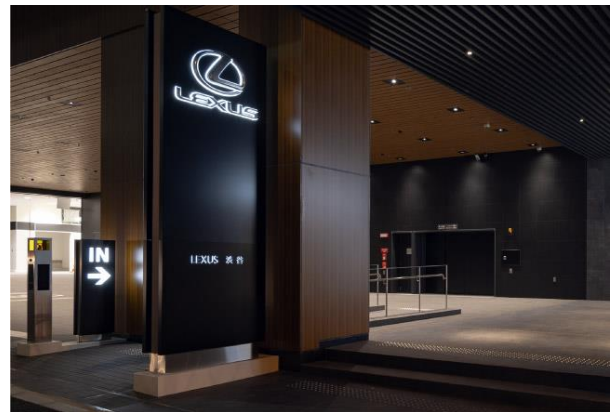
▲タワーパーキング