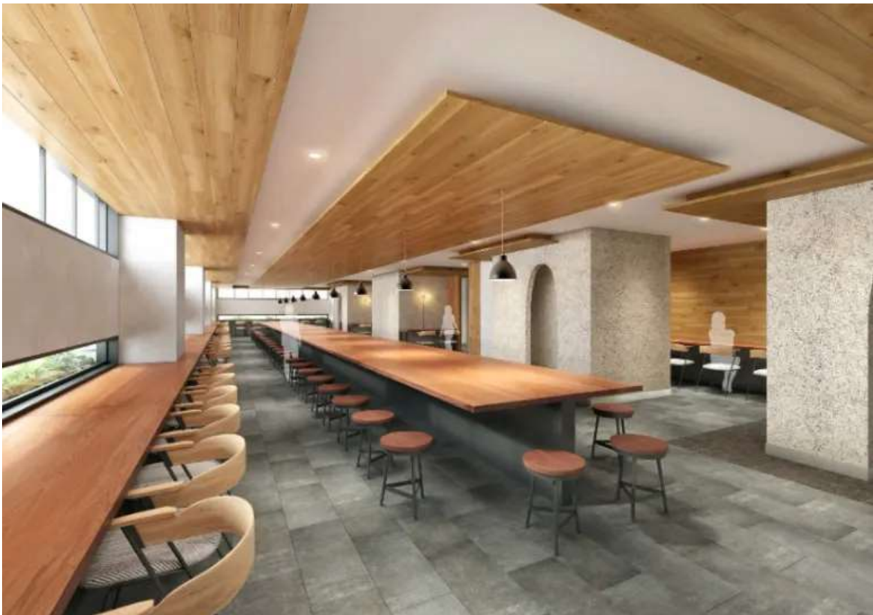
▲食堂ラウンジ完成予想 CG

食堂ラウンジにはひとつの大きなテーブルを配置。ひとつの大きなテーブルは学生同士を繋ぐ仕掛けになります。向こう三軒両隣、その時々で近くにいる学生が変わり、新たな関りを見つけることができます。みんなで囲うことで、様々な価値観を持った学生たちが交流を深めていきます。