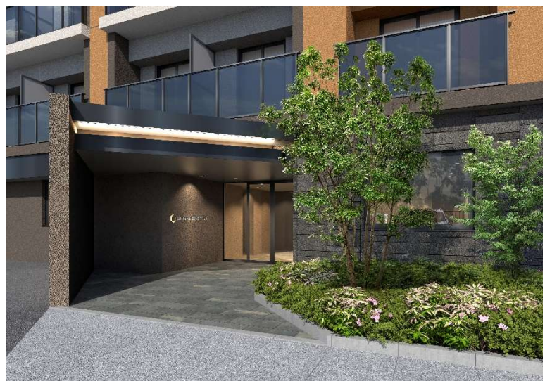
▲アプローチ完成予想 CG