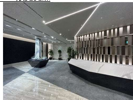
▲2F エントランスロビー

三菱地所レジデンス 大阪ギャラリーでは、今後大阪市内エリアで分譲する新築マンションの販売拠点として、2階に総合受付・ブランドルームとシアタールーム、模型を設置、16階にはプレゼンテーションルーム、モデルルーム、インテリアコーディネートルーム、商談ルームを設けています。2階のブランドルームでは、物件情報のプレゼンテーションの前に、三菱地所レジデンスの歴史・実績、サステナブルな取り組みなどの紹介を行い、フルスクリーンでの物件コンセプトシアター体験の後、16階のプレゼンテーションルームとモデルルームにて、物件情報を詳しくご案内します。