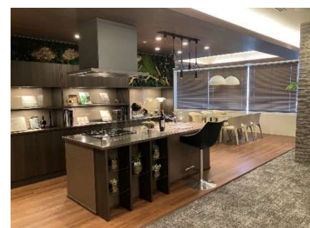
▲16階インテリアコーディネートルーム

グループ会社であるメック・デザイン・インターナショナルと協業し、お客様に住まいをご購入いただいてからご入居までにモノを選ぶ楽しさを体感してもらうために、通常の無償セレクトのご案内に加えて、個別設計変更の相談やドレスアップオプションの商品を実際にご覧いただきながら、ご検討いただける空間としました。