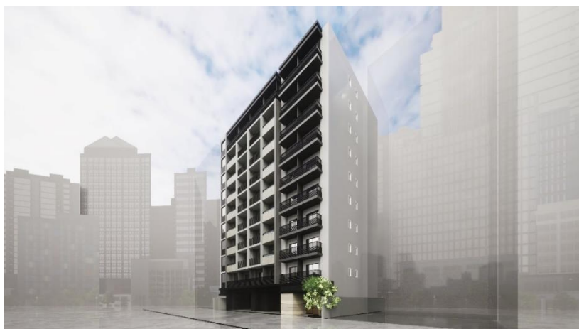
▲「ザ・パークハビオ 日本橋三越前」外観完成イメージ