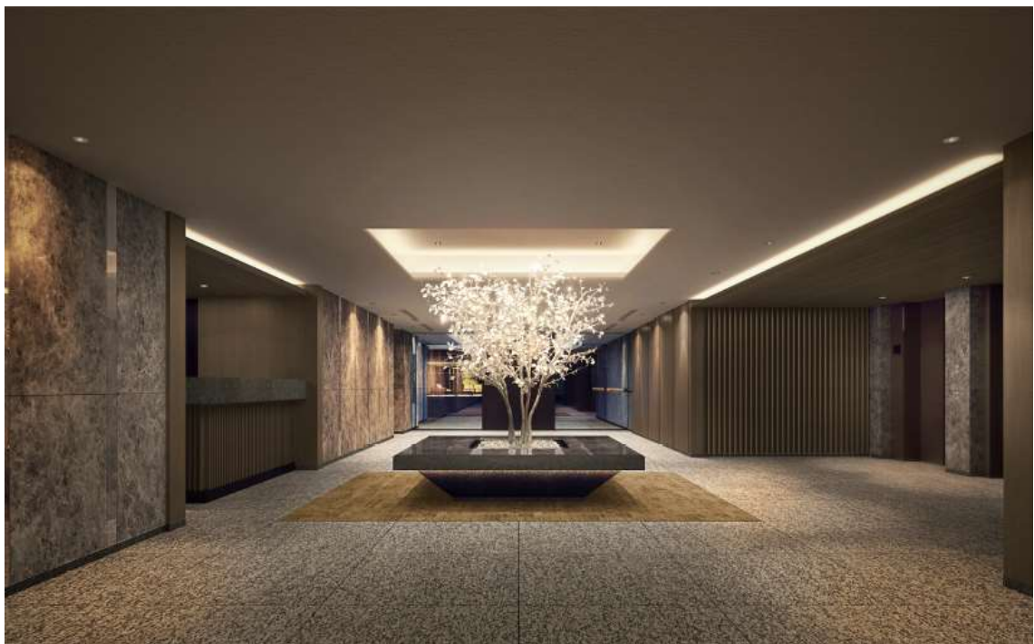
▲コンシェルジュ・エレベーターホール完成予想 CG