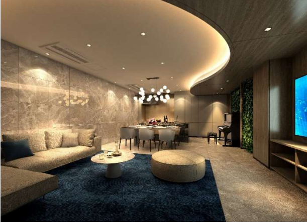
▲パーティールーム完成予想 CG