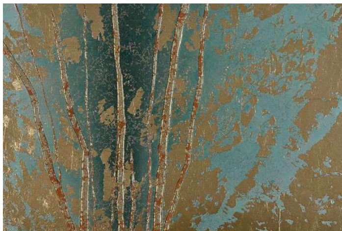
▲ガラスアート写真

建物に使用しているマテリアルは一つずつ厳選しております。特に、各共用部に配置している景石やアートは正に一点ものであり、唯一無二の空間を演出いたします。