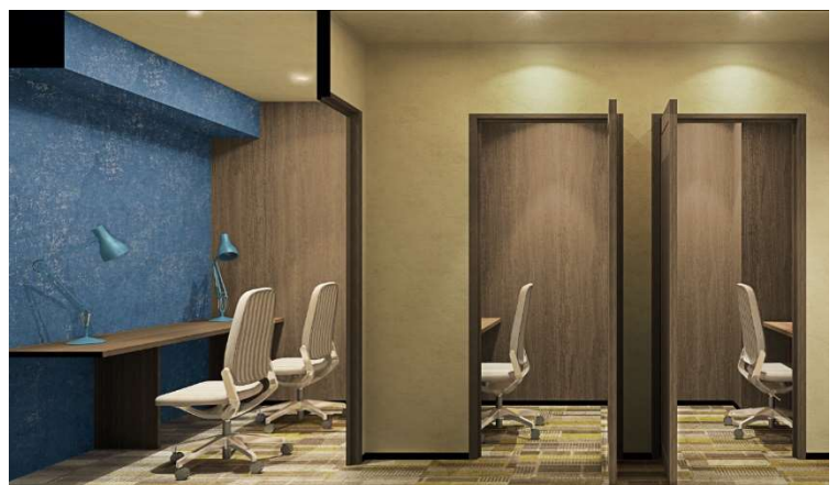
▲プライベートデスク完成予想 CG