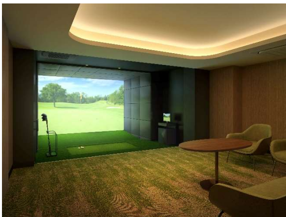
▲ゴルフレンジ完成予想 CG