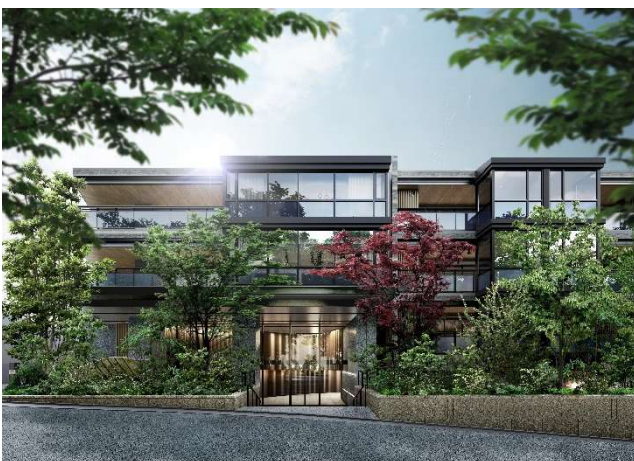
▲グランドエントランス完成予想 CG

緑陰を纏う低層の邸宅街区、かつ渋谷区の高台に誕生するランドマークに相応しい建物デザイン。ガラスを基調としたモダンなファサードは建物を美しく彩るだけでなく、奥行3mのパルコニーとして住まう方へのライフスタイルもデザインしています。