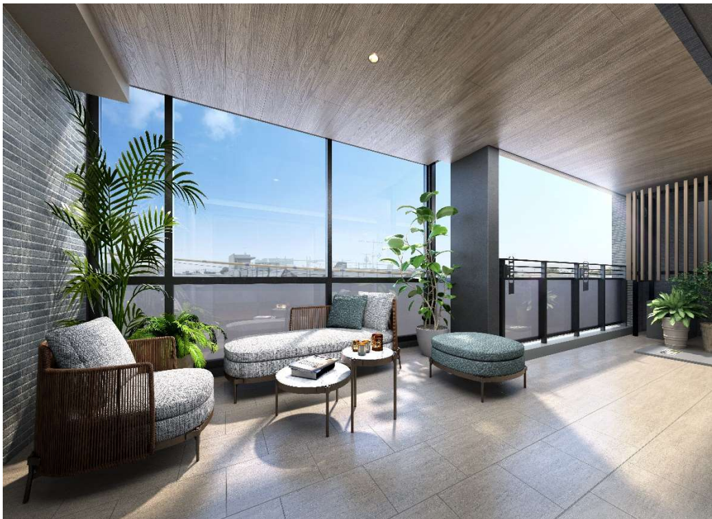
▲バルコニー完成予想 CG

また、この広いバルコニー空間を活かすために、ワイドリビングタイプではセンターオープンサッシを採用し、リビングとバルコニーが一体に感じられるようにしています。