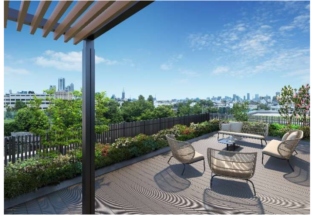
▲ルーフトップテラス完成予想 CG