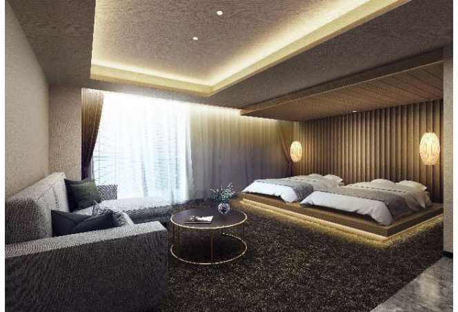
▲ゲストルーム完成予想 CG