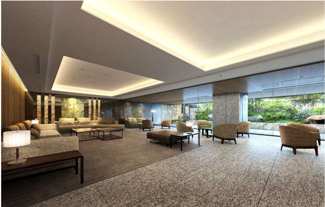
▲グランドラウンジ完成予想 CG