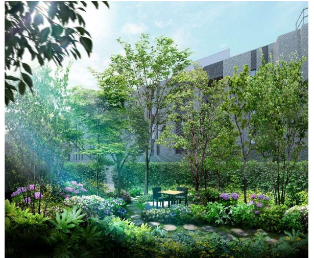
▲ガーデンパス完成予想CG

所在地：東京都渋谷区大山町 1083-2 ほか4筆（地番） 交通：東京メトロ千代田線「代々木上原」駅（西口）徒歩7分 小田急電鉄小田原線「代々木上原」駅（西口）徒歩7分 京王新線「幡ヶ谷」駅（南口）徒歩11分 敷地面積：8,002.73㎡（建築確認対象面積：2敷地合計） 構造・規模：鉄筋コンクリート造地上5階建 総戸数：140戸（募集対象外住戸7戸含む） 専有面積：63.05㎡～153.13㎡ 間取り：2LDK・3LDK 販売価格：未定 施工：東亜建設工業株式会社 東日本建築支店 竣工：2025年11月下旬（予定） 入居：2026年2月下旬（予定） 売主：三菱地所レジデンス株式会社 販売スケジュール：第1期 2023年11月中旬販売開始予定