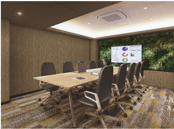
▲ボードルーム完成予想 CG