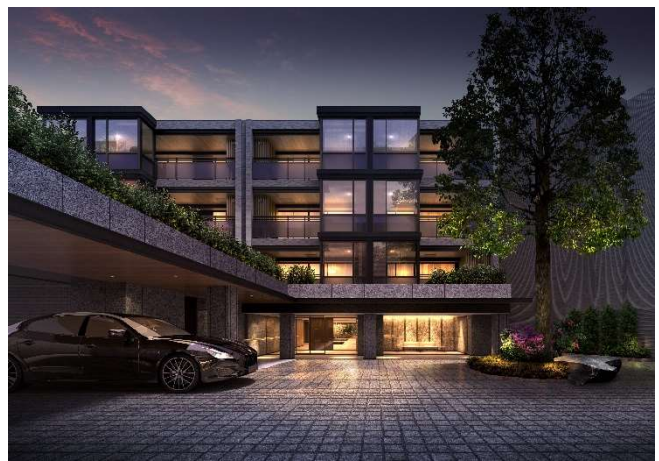
▲センタースクエア完成予想 CG