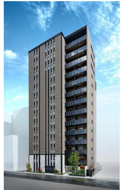
▲「ザ・パークハウス 麹町三丁目」外観完成予想 CG

所在地：東京都千代田区麹町3丁目7番3他1筆（地番） 交通：東京メトロ半蔵門線「半蔵門」駅（6番出口）徒歩3分、 東京メトロ有楽町線「麹町」駅（1番出口）徒歩3分、 JR中央線「四ツ谷」駅（麹町口）徒歩12分、 東京メトロ南北線「永田町」駅（4番出口）徒歩8分 総戸数：57戸（募集対象外住戸25戸含む）、 他に店舗1戸（募集対象外） 構造・規模：鉄筋コンクリート造 地上14階・地下1階建 敷地面積：570.21㎡（売買対象面積）、 524.58㎡（建築確認対象面積）、 他に私道負担面積45.63㎡ 用途地域：商業地域・麹町地区地区計画(B-1計画) 間取り：1LDK～3LDK 専有面積：42.85㎡～90.65㎡ (戸別宅配ボックス面積0.64㎡を含む) 価格：未定 竣工：2026年5月上旬（予定） 引渡：2026年6月下旬（予定） 売主：三菱地所レジデンス株式会社 施工：東急建設株式会社 販売スケジュール：2024年11月下旬販売予定 物件HP： https://www.mecsumai.com/tph-kojimachi3chome/