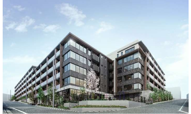
▲「ザ・パークハウス 宮前平二丁目」外観完成予想 CG

所在地：神奈川県川崎市宮前区宮前平2丁目13番1（地番） 交通：東急田園都市線「宮前平」駅 徒歩3分 ※北口 総戸数：154戸 構造・規模：鉄筋コンクリート造地上7階建 敷地面積：6,385.32㎡(売買対象面積) 用途地域：第一種中高層住居専用地域 間取り：1LDK～3LDK 専有面積：59.50㎡～94.19㎡ 価格：未定 竣工：2025年11月中旬（予定） 引渡：2026年1月中旬（予定） 売主：三菱地所レジデンス株式会社 施工：木内建設株式会社 販売スケジュール：2024年9月中旬販売開始予定 物件HP： https://www.mecsumai.com/tph-miyamaedaira2/