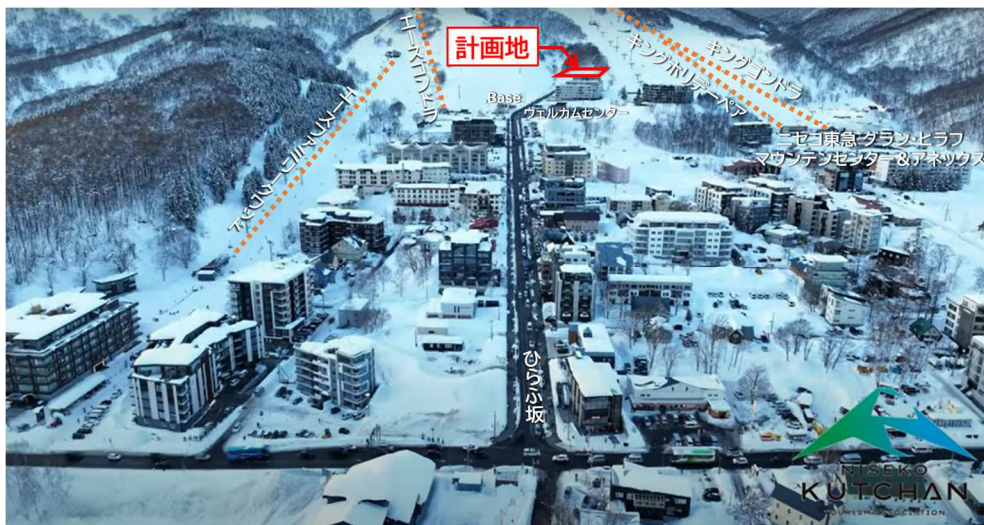
星のやヒュッテ ニセコ (仮称) 計画地

計 画 地 : 北海道虻田郡倶知安町字山田 204 番 2、204 番 69 他 構 造 ・ 規 模 : 鉄筋コンクリート造一部鉄骨構造・地下 2 階 地上 5 階 敷 地 面 積 : 6,462.83 m 2 建 築 面 積 : 2,409.83 m 2 延 べ 面 積 : 14,870.36 m 2 客 室 数 : 62 室 工 期 ( 予 定 ) : 2024 年 10 月 14 日～2029 年 2 月末 ( 予 定 ) 開 業 予 定 : 2029 年度 ( 予 定 ) 施 工 会 社 : 前田・伊藤・盛永・廣野・日軽特定建設工事共同企業体 設 計 者 : 東 環 境 ・ 建 築 研 究 所