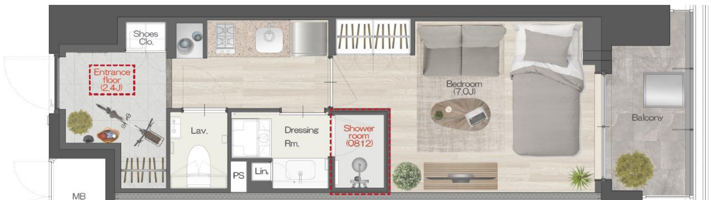
▲土間プランイメージ