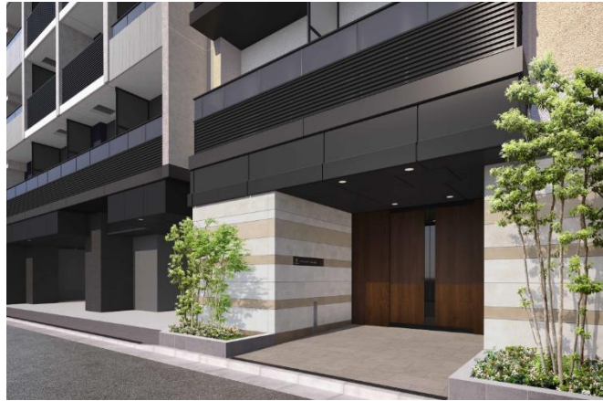
▲「ザ・パークハビオ 日本橋三越前」 エントランス完成イメージ