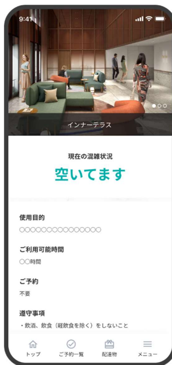
「スミカレジデンスアプリ」イメージ