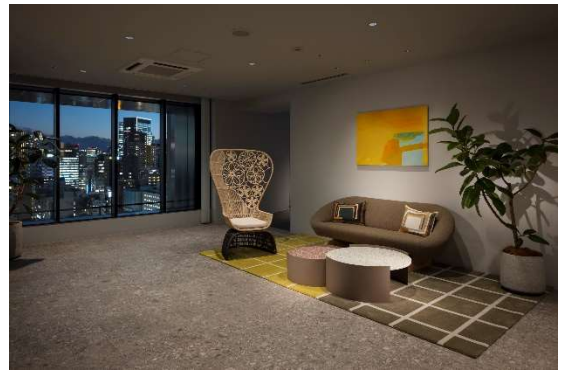
コミュニケーションラウンジ