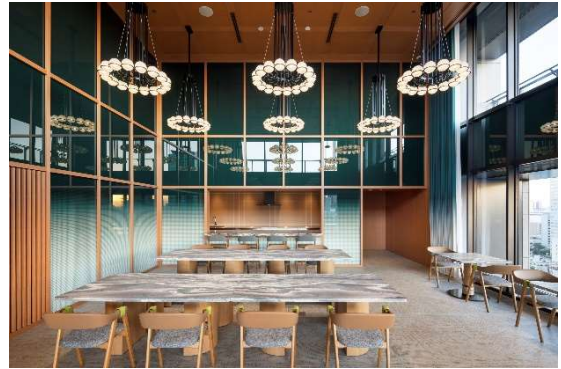
パーティールーム