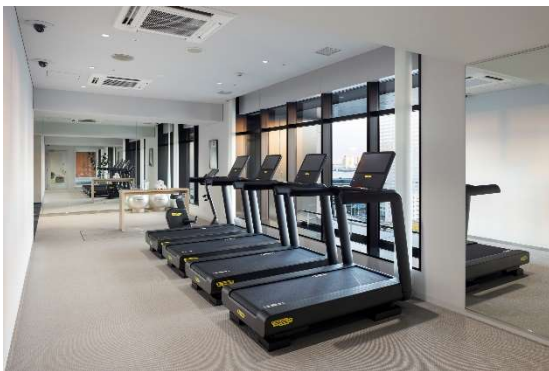
フィットネスルーム